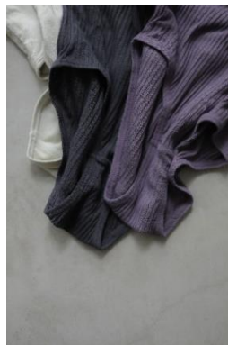
リブハイレイズショーツ ¥3,200