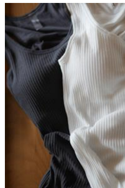
カップ付きタンク ¥5,800